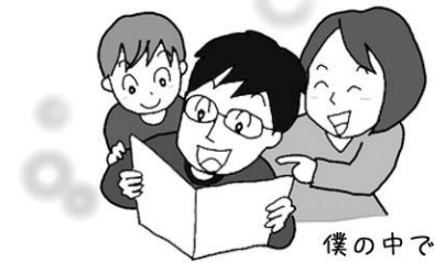
僕の中での想像図