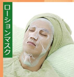
ローションマスク

セラミド配合のフォームでお肌の水分量を減らさず、ヒゲ・うぶ毛・老廃物を除去し。しっかりと滑らかなお肌に仕上げます